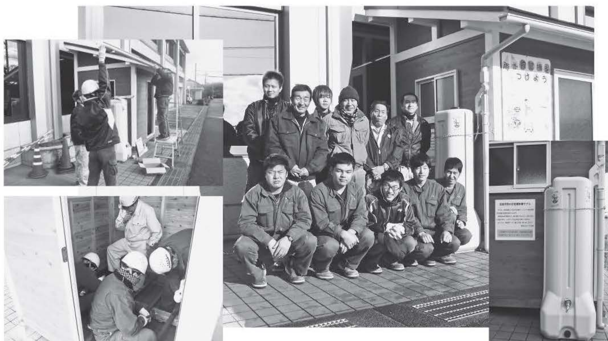
京都府立福知山高等技術専門校生徒のみなさんによる製作の様子

京都府立福知山高等技術専門校のご協力を得て、上下水道部庁舎に、雨水貯留槽の設置モデルを展示しています。