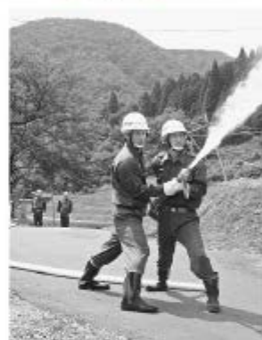
竣工式に地元消防団による放水