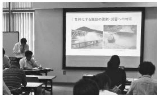
夜久野ふれあいプラザ